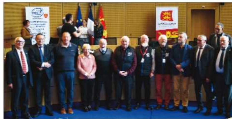
Les représentants des cinq comités départementaux qui constituent le comité de Normandie

La matinée s'est achevée par l'organisation du traditionnel verre de l'amitié au cours duquel chacun a pu échanger sur son engagement, ses objectifs et ambitions mais aussi sur les difficultés à surmonter.