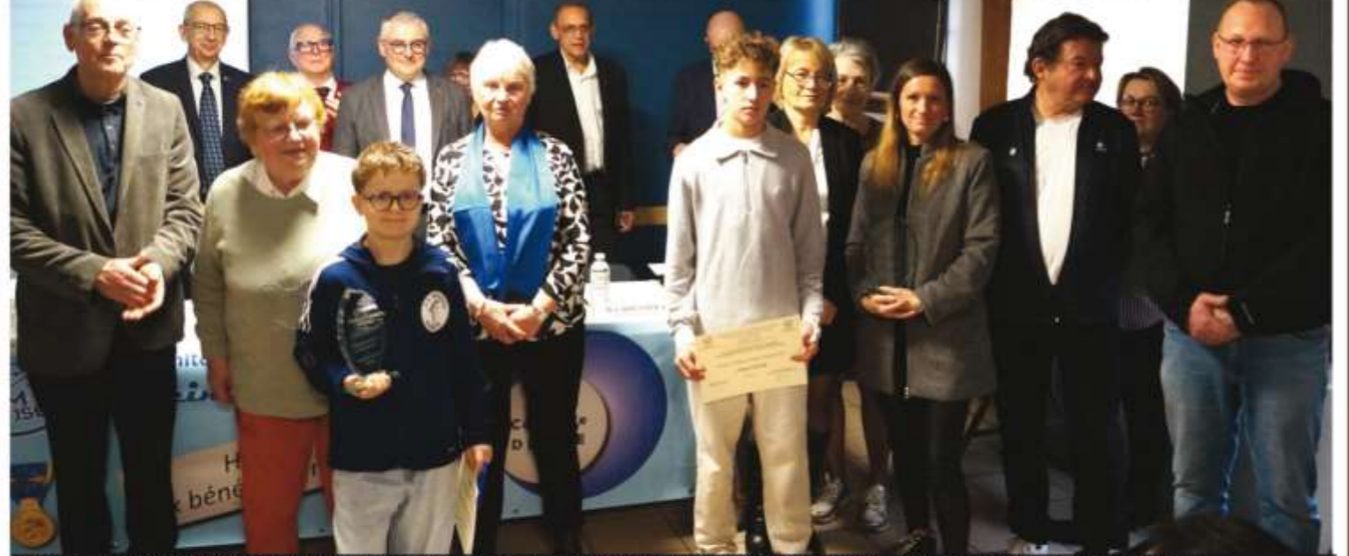
Les jeunes sportifs méritants du Cercle dieppois récompensés posent au côté des membres de ce Cercle et de leurs proches